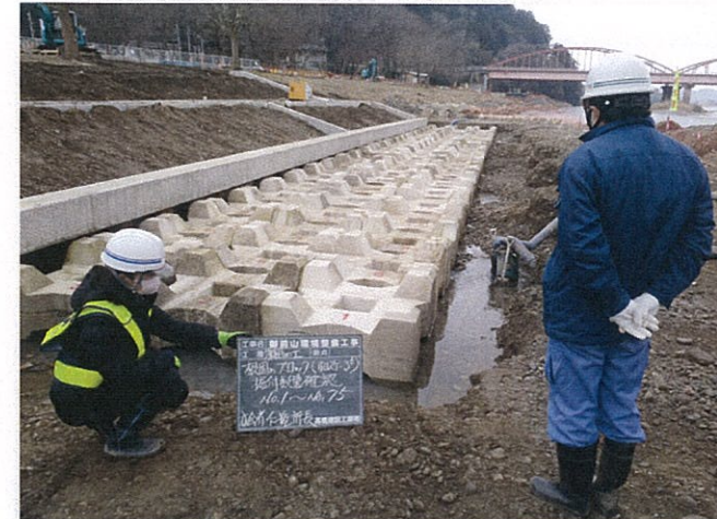
根固めブロック工