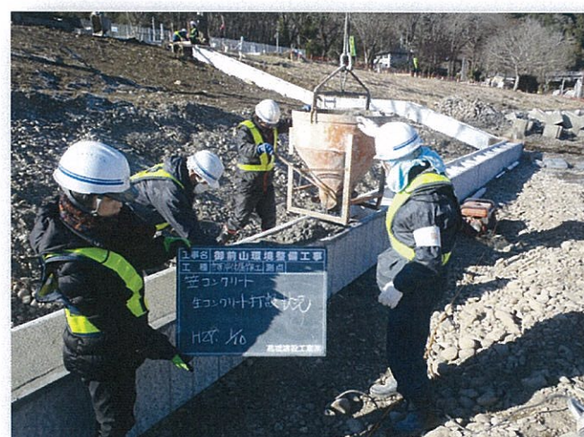
笠コンクリート工