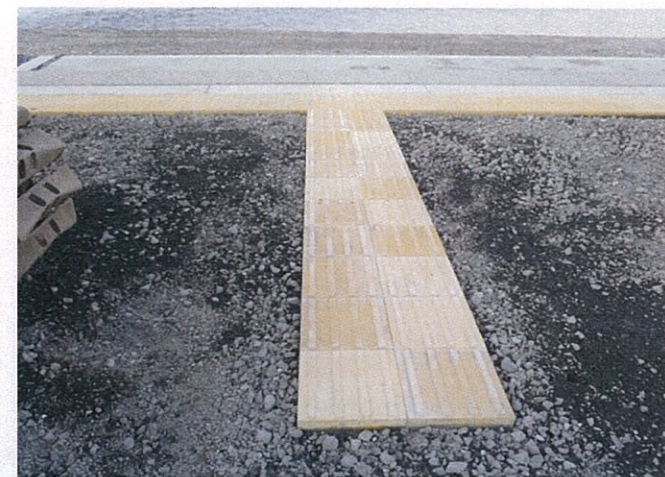
点字ブロック設置