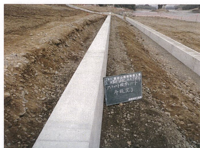
帯コンクリート工