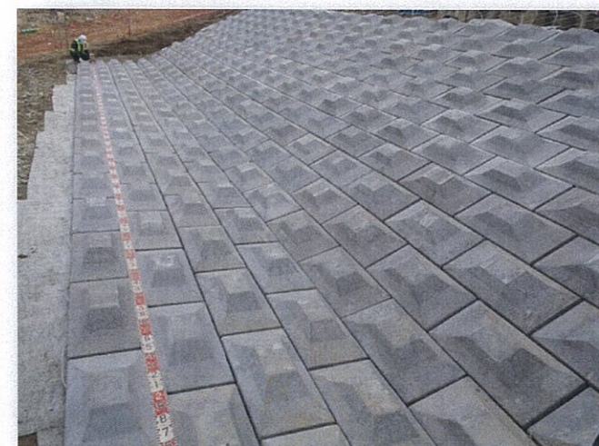
大型連節ブロック工