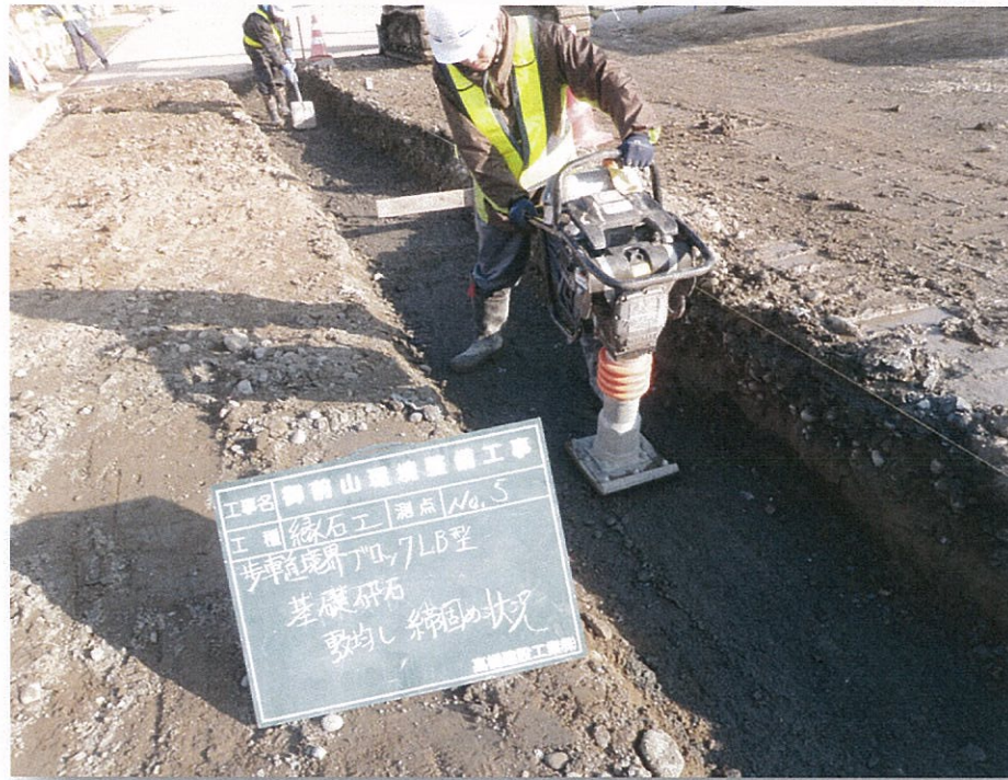
歩車道境界ブロック