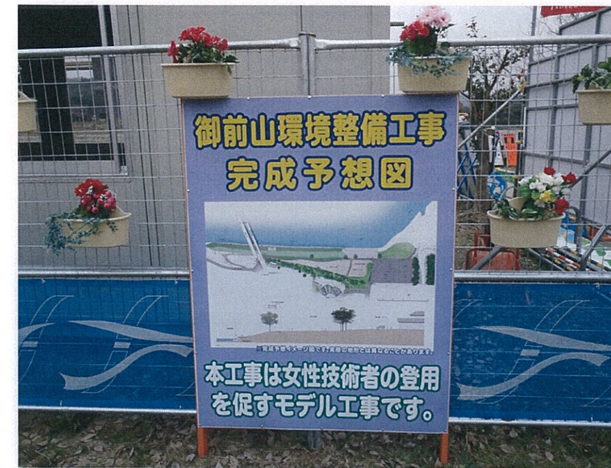
完成予想図の設置