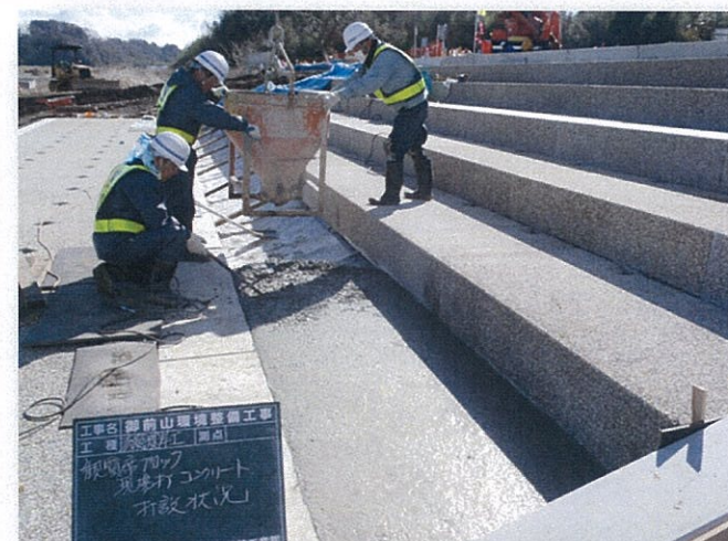
大型階段ブロック工