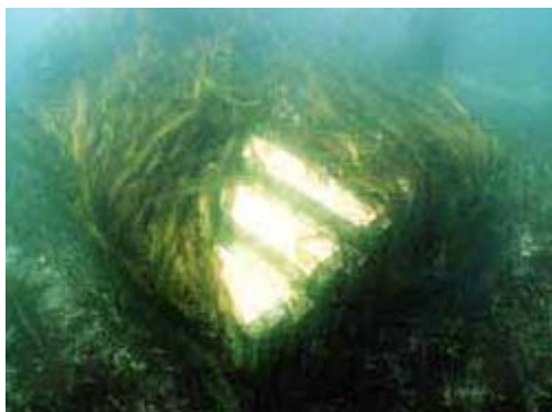
アルガロックの海藻着生状況

海藻は地上の植物と同様、光合成により酸素を供給し海水を浄化し、魚や海中生物の生息域をつくれます。アルガロックは藻場礁だけでなく、港や防波堤のマウンド被覆に使われ、海藻が付着しやすい構造になっています。アルガロックは藻場づくりを通して、きれいで豊かな海づくりの役に立っています。