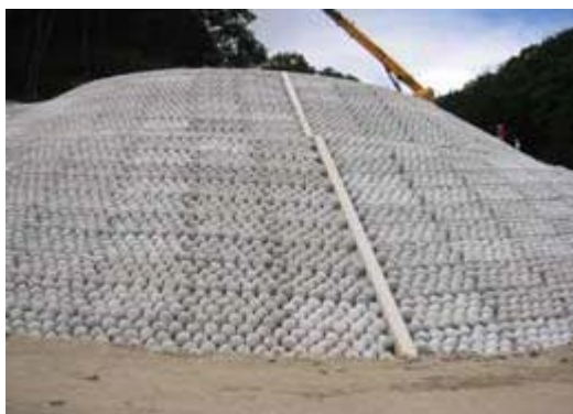
曲線部への実施例