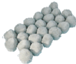
イーストストーンラップ（単体図）

イーストストーンラップ工法は、擬石玉石（イーストストーン）を亜鉛・アルミメッキ鋼線で連結し、河岸の勾配変化に順応的に対応して据付けることが出来る護岸工法です。1個2m 2 の大型製品で、ローコストで施工性の高い工法です。