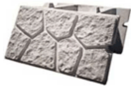
ウォールストーン（単体図）

50型、75型、100型、150型の4種類があります。擁壁の高さや土圧に対応した組み合わせ構造により、経済的な断面設計ができます。